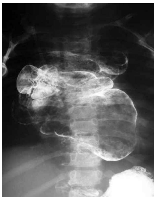
Figura 2. Reflujo gastrocólico severo tras esofagocoloplastia por atresia de esófago tipo III.

Un último paciente con FTE operado al nacimiento y con evolución tórpida, que precisó múltiples dilataciones y 3 funduplicaturas por reflujo gastroesofágico severo con repercusión respiratoria, fue candidato a ECP, que resultó imposible ante el hallazgo de una mediastinitis severa y numerosas bronquiectasias. Fue remitido por la edad al Servicio de