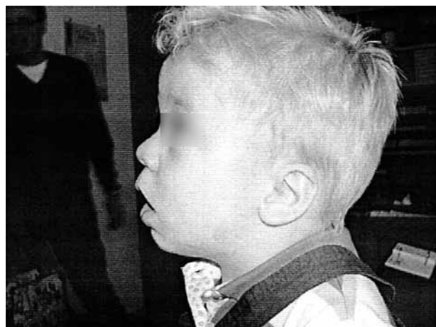
Figura 3. Resultado a los 18 meses de la intervención. Mínimas marcas en los orificios de inserción de los pires.

po mandibular o bien con algún grado de anquilosis de tipo extraarticular. En todos los casos encontramos una apertura oral limitada por la escasa longitud del cuerpo y rama mandibular. Dentro de los estudios preoperatorios de rutina se realizó una TAC 3D (Fig. 1) y la fibroscopia diagnóstica localizó el sitio de la obstrucción, que en todos los casos fue a nivel del espacio faríngeo superior, evidenciándose la retroposición lingual. También se tomaron fotos para documentar por completo los casos clínicos (Figs. 2 y 3).