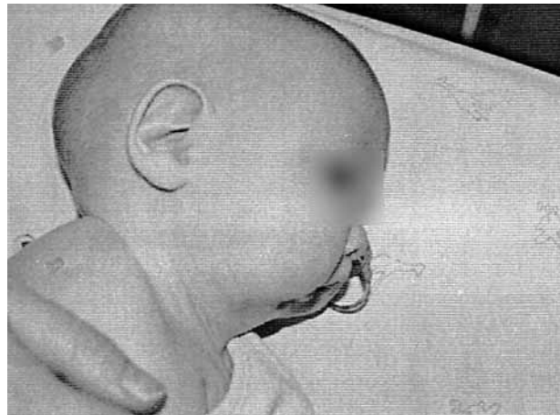
Figura 2. Fotografía preoperatoria del caso 3.

La apnea obstructiva fue diagnosticada por examen clínico de la hipoplasia mandibular severa y la insuficiencia respiratoria se evidenció mediante monitorización de la saturación de oxígeno. Se evaluó también la articulación temporomandibular; muchos pacientes micrognáticos presentan limitaciones de grado variable de la apertura bucal, relacionada directamente con alteraciones morfológicas del cóndilo, factores mecánicos secundarios a la poca longitud del cuer-