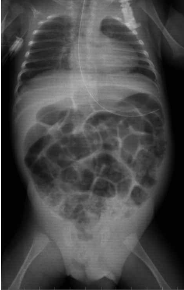
Figura 2. Radiografía del paciente en el momento del diagnóstico de oclusión intestinal. Se observa gran distensión de asas así como la presencia de aire en la región inguinal derecha.

En nuestro caso, el diagnóstico de hernia de Richter se realizó en el acto quirúrgico, al igual que lo reportado en las publicaciones revisadas. Por último, y como conclusión importante, señalar que, a pesar de lo infrecuente que resulta este tipo de hernia en Pediatría, debemos tenerla en cuenta a la hora de establecer el diagnóstico diferencial entre las causas de oclusión intestinal en neonatos y lactantes que se presenten con historia clínica previa de hernia inguinoescrotal o de escroto agudo así como en niños a quienes se les haya practicado una laparoscopia y presenten algún tiempo después sintomatología abdominal oclusiva o suboclusiva.