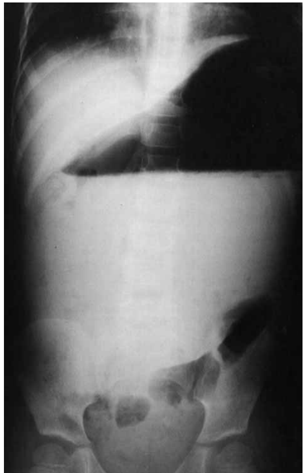
Figura 2. Rx de abdomen en bipedestación: presencia de nivel hidro-aéreo, que desplaza el colon transverso.