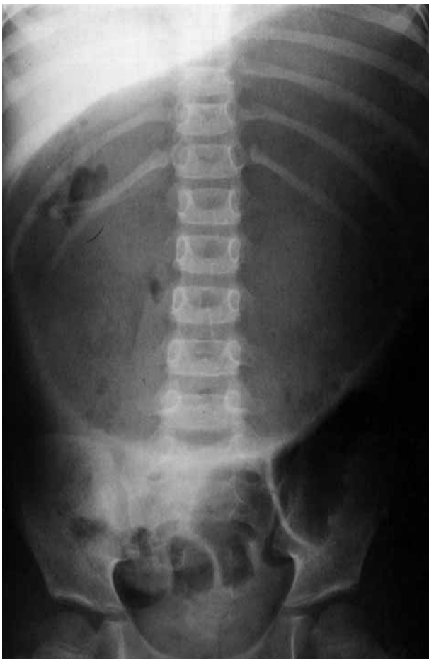
Figura 1. Rx simple de abdomen: gran distensión de cámara gástrica.