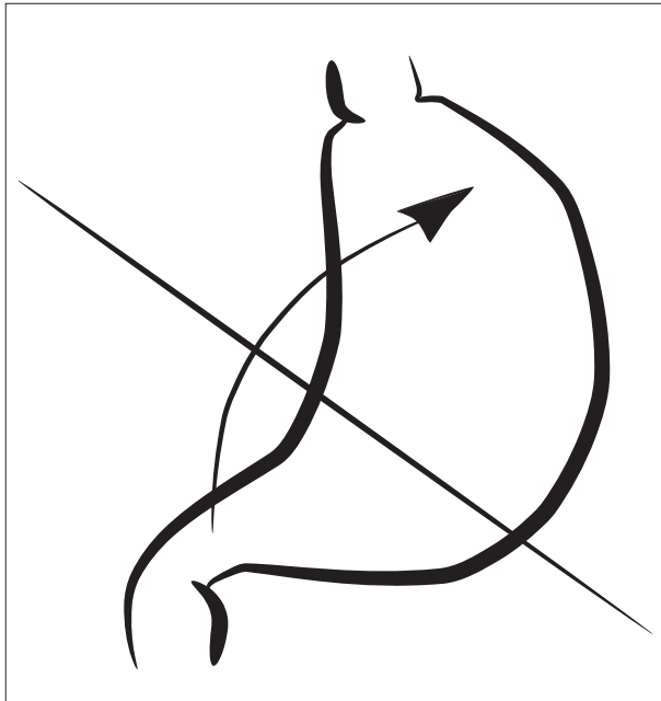
Figura 4. Vólvulo gástrico mesentereo-axial.

ausencia o elongación de las fijaciones gástricas, desórdenes en la anatomía o función gástrica como es el caso de obstrucción en el vaciamiento gástrico, hipomotilidad, etc., o anomalías en órganos adyacentes: hernias del hiato, hernia de Bordalect, eventración diafragmática, parálisis del nervio frénico, esplenomegalias, etc. (7-10) .